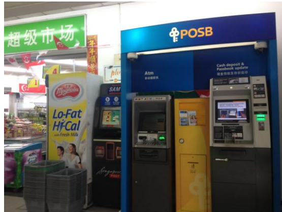
提款机、诊所、影印店