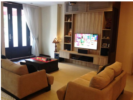
客厅，LED 电视和音响系统