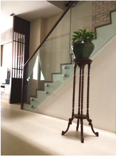
Tangga ke tingkat atas