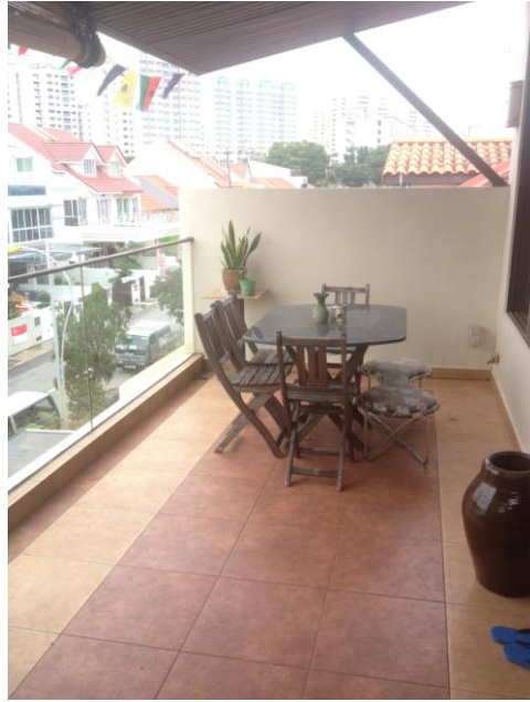
Balkon menghadap matahari erbit